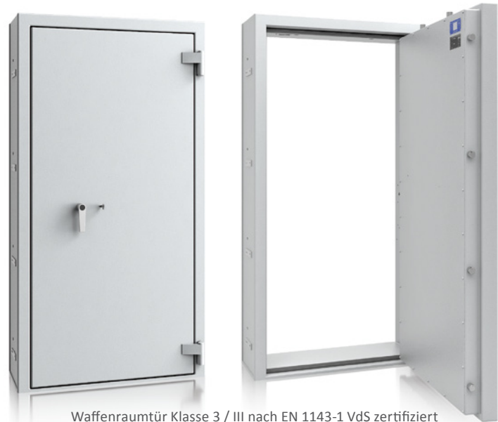
Waffenraumtür Klasse 3 / III nach EN 1143-1 VdS zertifiziert