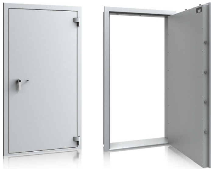
Waffenraumtür Klasse 1 / I nach EN 1143-1 ECB-S zertifiziert