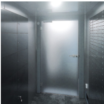
Abbildung: Sonderausführung Tagesgittertür

Standardverschluss bei Tagesgittertüren ist ein Profilzylinderschloss. Optional besteht die Möglichkeit der elektrischen Türöffnung durch einen elektronischen Türöffnerkontakt und die Zwangsverschiebung durch einen aufgebauten Gleitschienenschließer.