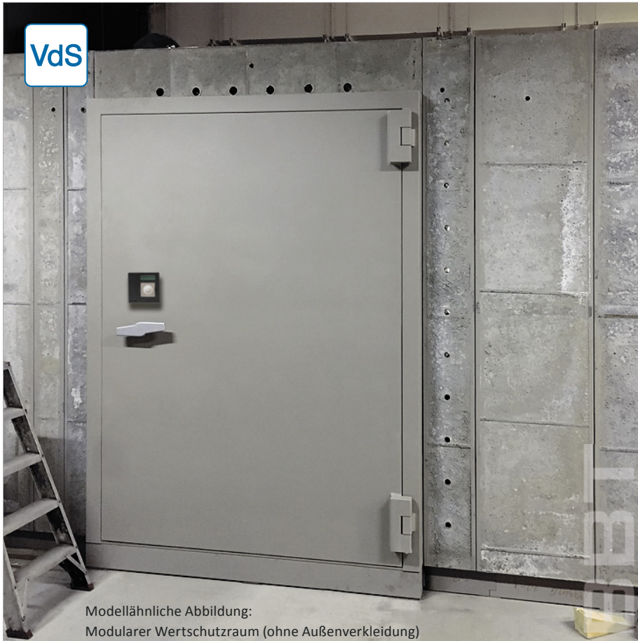
Modellähnliche Abbildung: Modularer Wertschutzraum (ohne Außenverkleidung)

Errichtung von Tresorräumen in modularer Trockenbauweise Raum-in-Raum Systeme Komponenten-Tresorräume