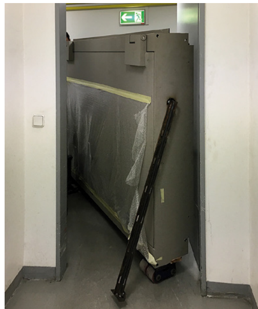
Transport der Wertschutztür