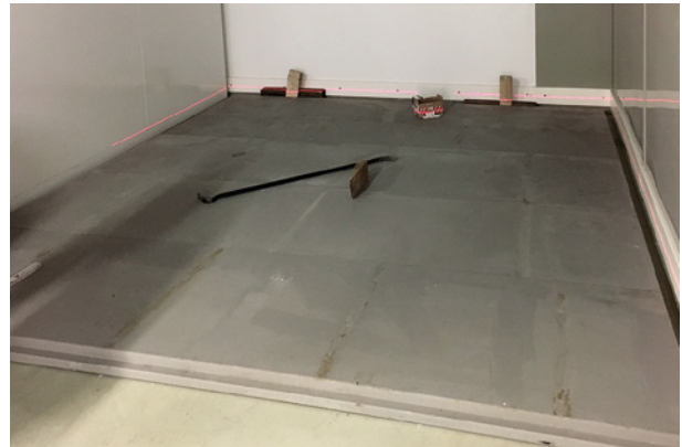
Verlegung des Modulraum-Bodens