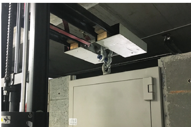
Setzen der Wertschutztür im Raum