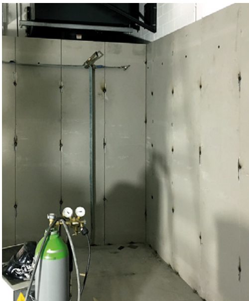
Aufbau Wandelemente (Verschweißung)